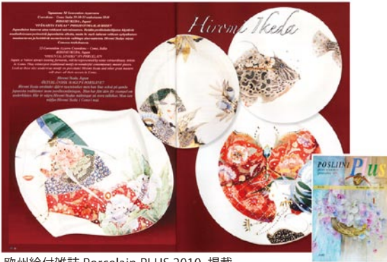
欧州絵付雑誌 Porcelain PLUS 2010. 掲載。