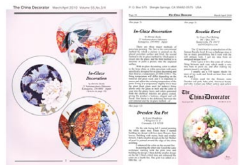
USA 絵付協会雑誌 The China Decorator 2010. 掲載。