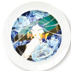
ミラノ郊外陶磁器博物館展示